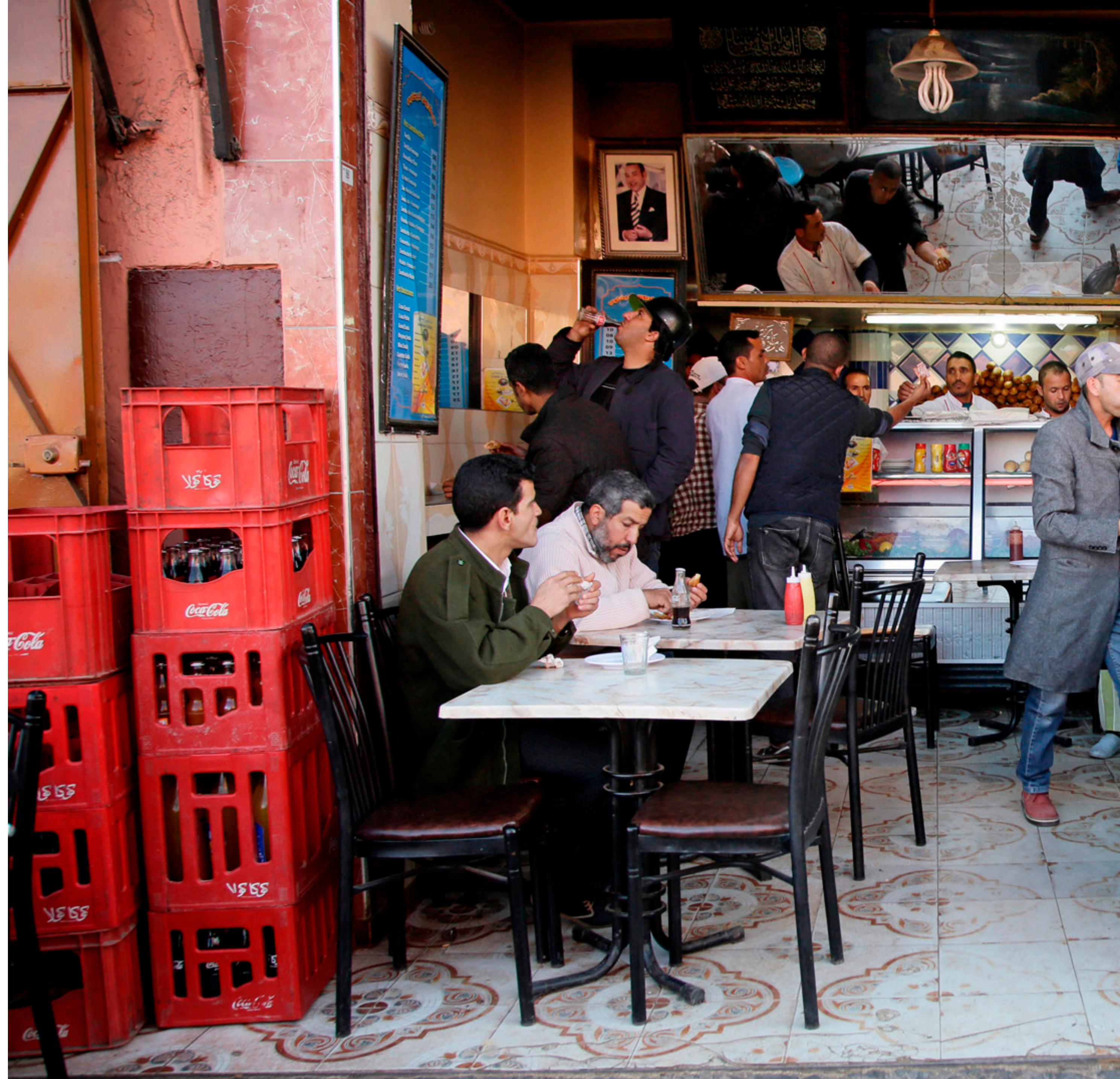
Imbiss in Marrakesch, Marokko