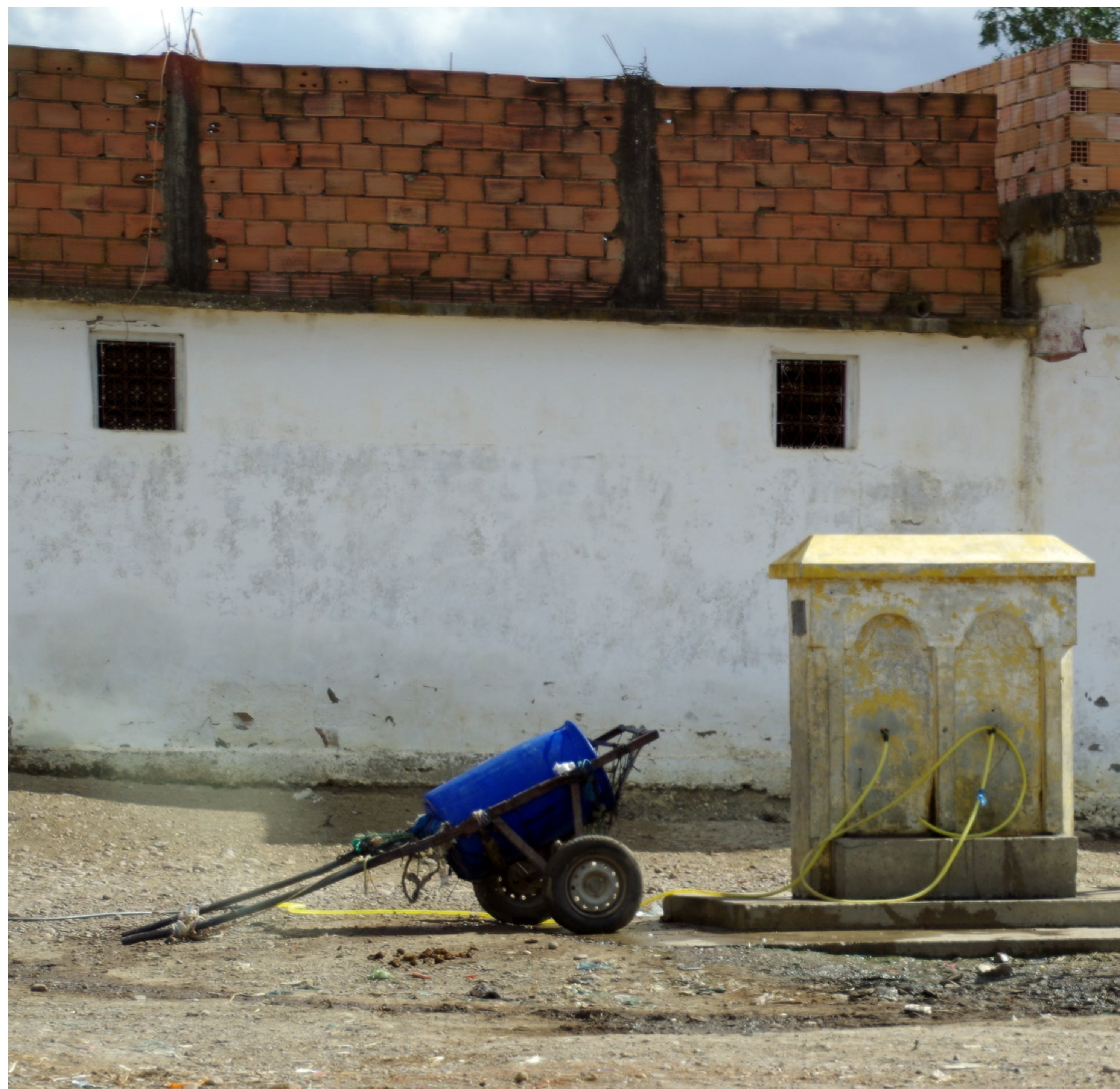
Ein Bauer holt Wasser an einem öffentlichen Brunnen in Marokko.

Bei der Trinkwasser- und Stromversorgung sind deutliche Fortschritte zu verzeichnen. Mittlerweile hat nahezu die gesamte Bevölkerung Zugang zu Strom. Etwa 95 Prozent der Haushalte verfügen über einen Wasseranschluss.