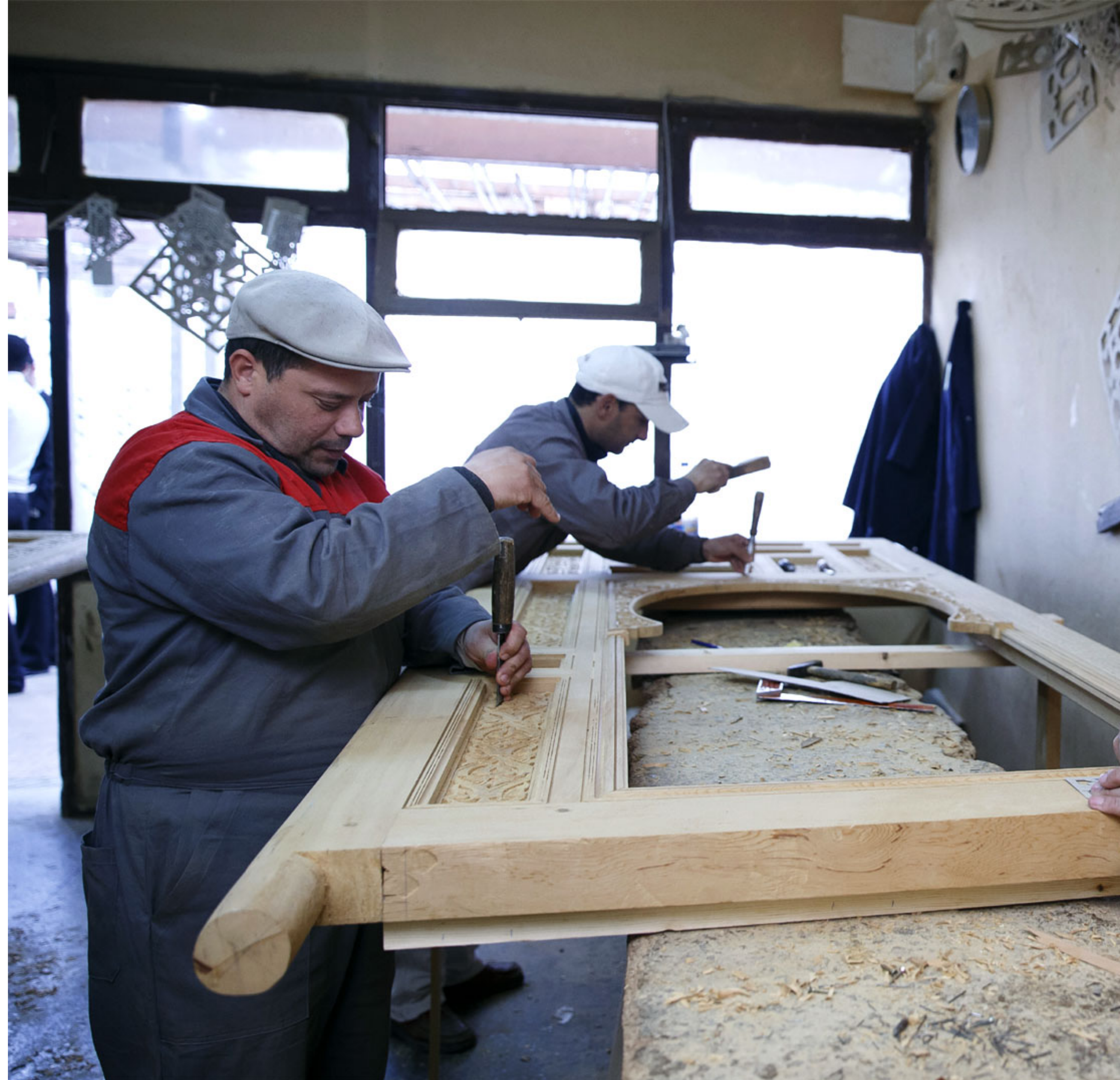
Holzschneiderarbeiten an einer Tür im Zentrum für Kunsthandwerk in Meknes