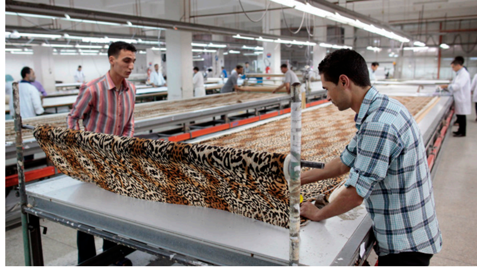
Mitarbeiter in einer Textilfabrik in Marokko, die ein duales Ausbildungssystem nach deutschem Vorbild anbietet.