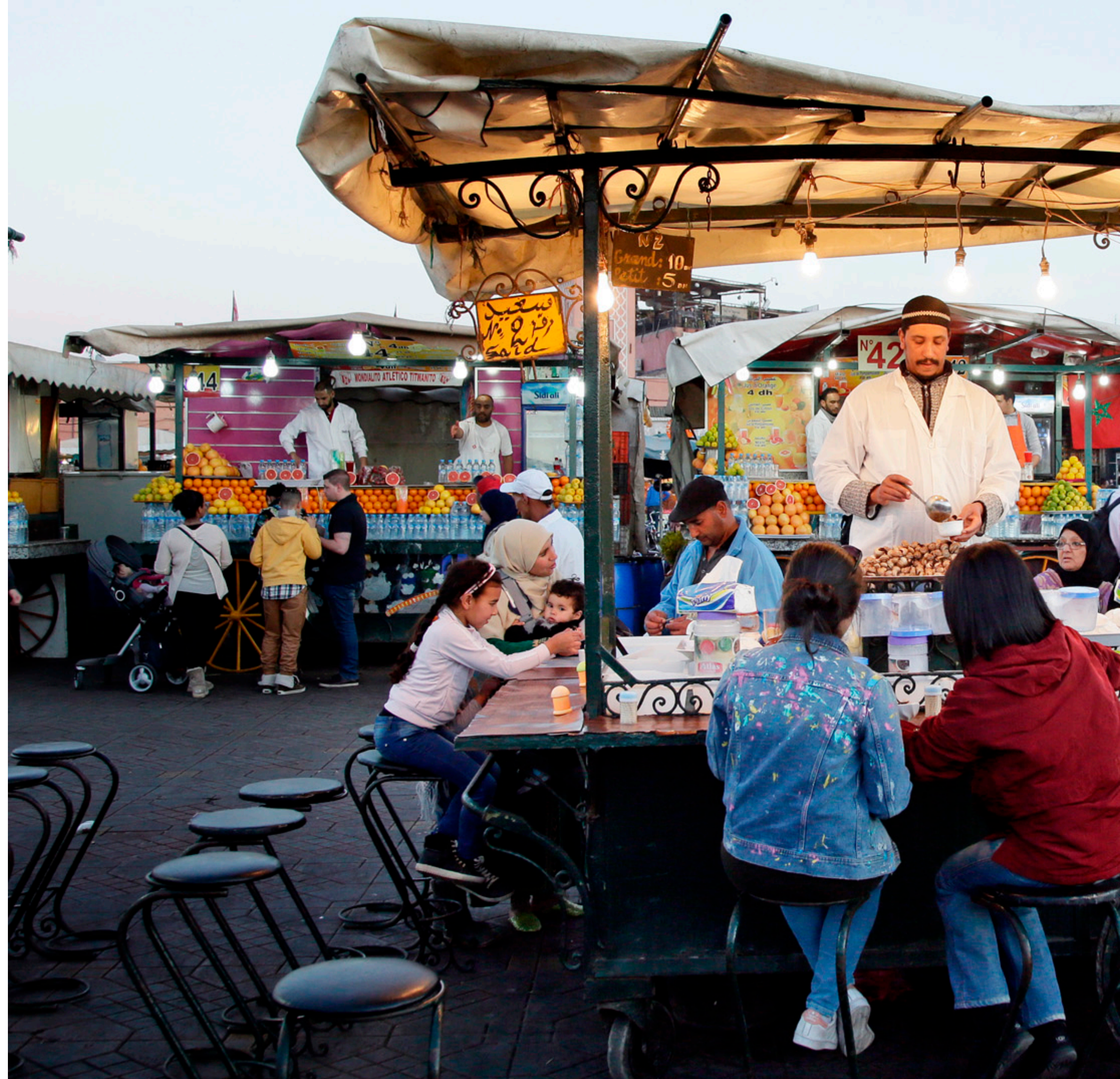
Verkauf von Muschelsuppe – Essensstand auf dem Platz Djemaa el-Fna in Marrakesch, Marokko