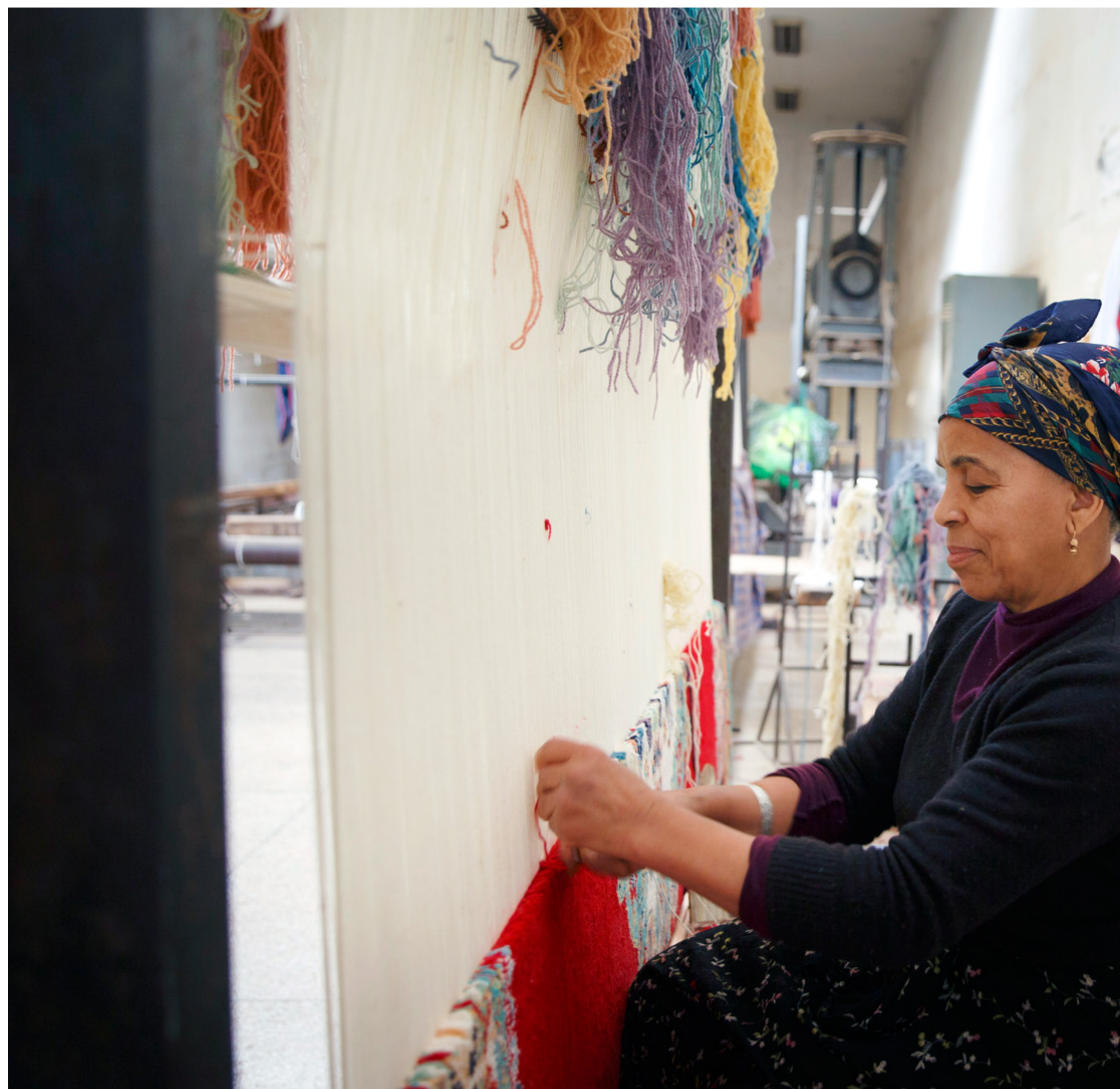
Eine Frau beim Teppichknüpfen im Zentrum für Kunsthandwerk in Meknes, Marokko

Die marokkanische Regierung hat ein nationales Programm zur Förderung der Gleichstellung auf den Weg gebracht, die rechtliche Situation von Frauen hat sich im Vergleich zu anderen Ländern der Region im letzten Jahrzehnt verbessert. Doch ihre Chancen auf einen Ausbildungs- und Arbeitsplatz bleiben durch soziale und kulturelle Einschränkungen begrenzt. So sind etwa nur zehn Prozent der Inhaber formeller Unternehmen Frauen.