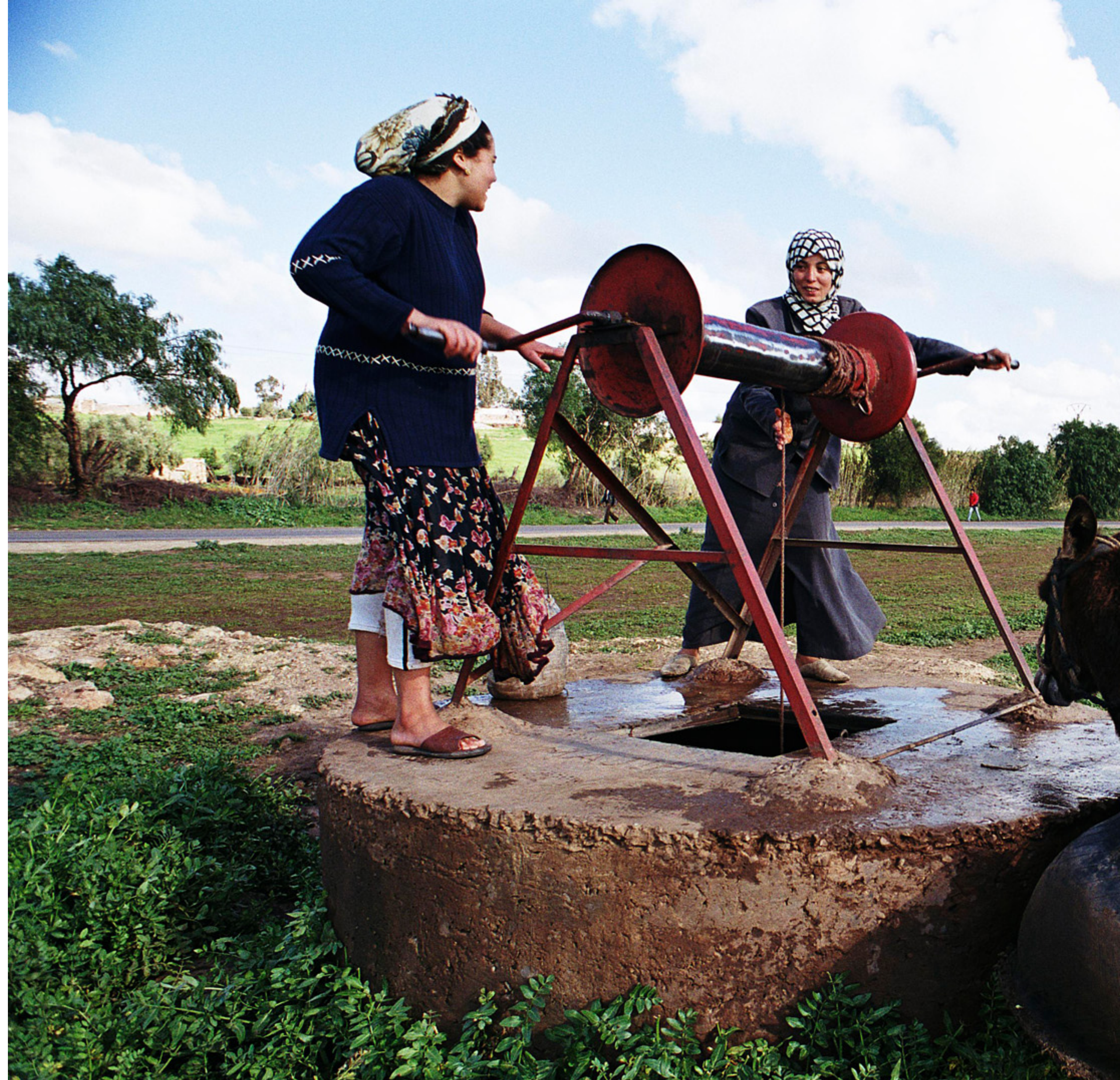
Frauen holen Wasser an einem Brunnen in Marokko.