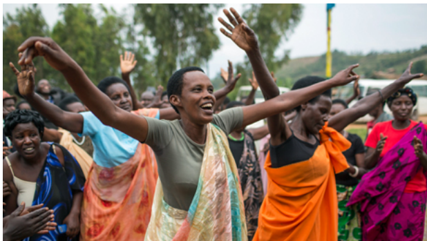
Zeitzeuginnen des Genozids in Ruanda tanzen und singen bei einer Veranstaltung zur Trauma- und Konfliktbewältigung.