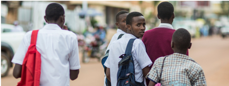
Menschen auf einer Straße in Huye, Ruanda

Die Folgen des Völkermordes von 1994 zu bewältigen, bleibt eine große Herausforderung für Ruanda. Grundlagen für eine stabile Entwicklung sind die Versöhnung und die Vermeidung von neuen Konflikten. Die Lebensbedingungen insbesondere der ländlichen Bevölkerung sind trotz erheblicher Fortschritte noch immer schlecht. Unter anderem haben fast 40 Prozent der ruandischen Bevölkerung keinen Zugang zu angemessenen Sanitäreinrichtungen. Die durchschnittliche Lebenserwartung beträgt 67 Jahre (2015), die Bevölkerung wuchs im Jahr 2016 um 2,4 Prozent.