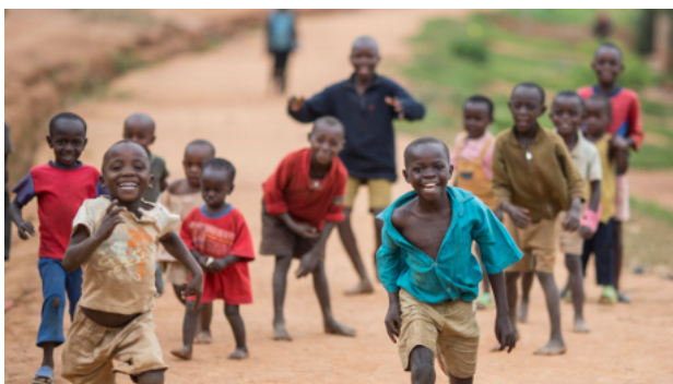
Spielende Kinder in einem kleinen Dorf in Ruanda

Im Bildungsbereich wurden beachtliche Fortschritte erzielt. So ließ die Einführung einer kostenlosen Schulbildung die Einschulungsrate deutlich steigen: 2015 betrug die Einschulungsrate in der Grundschule 95 Prozent aller schulpflichtigen Kinder in Ruanda, 2002 waren es nur 82 Prozent. Auch die Dauer des Schulbesuchs hat sich deutlich verlängert: Während ein Kind im Jahr 2005 noch durchschnittlich 8,3 Jahre eine Schule besuchte, so blieb es 2014 schon für 10,3 Jahre eingeschult. Allerdings brechen noch immer fast 40 Prozent der Kinder die Grundschule vorzeitig ab.