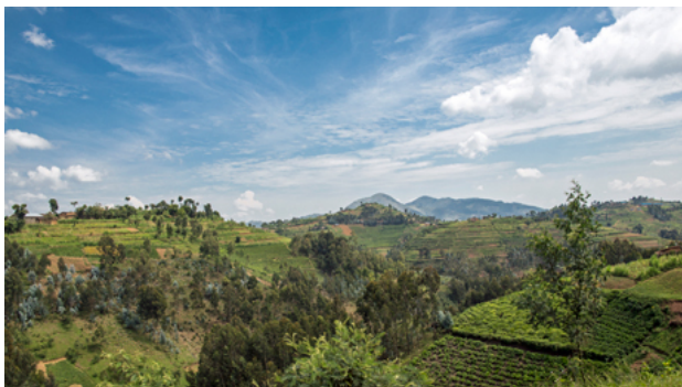
Landschaft bei Musebeya, Ruanda

Ruandas Bevölkerung wächst zwar langsamer als in der Vergangenheit, aber immer noch sehr schnell und die natürlichen Ressourcen des Landes sind begrenzt. Dadurch wachsen die Umweltprobleme: Durch zu intensive Nutzung und Erosion werden immer mehr Böden zerstört und die landwirtschaftlich nutzbare Fläche schrumpft. Gleichzeitig sind vor allem ländliche Gegenden immer öfter von extremen Wetterereignissen wie Dürren und Starkregen betroffen. Die Regierung unterstützt daher Terrassierungs- und Ressourcenschutzprogramme. 2013 wurde zudem ein nationaler Finanzierungsmechanismus zur Anpassung an den Klimawandel sowie zur Ausrichtung der Privatwirtschaft an Klimaminderungszielen (FONERWA) eingerichtet, an dem sich auch die Bundesregierung beteiligt.