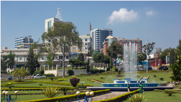
Grünanlage in Kigali, Ruanda

Das erklärte Ziel der ruandischen Regierung ist es, durch wirtschaftliches Wachstum die Lebensbedingungen der gesamten Bevölkerung zu verbessern. Ein wichtiger Partner dafür ist die Privatwirtschaft. Im "Doing Business"-Bericht 2018 der Weltbank – er bewertet die Rahmenbedingungen für wirtschaftliche Aktivitäten – belegt Ruanda Platz 41 von 190 aufgelisteten Staaten. Das Land liegt damit, nach Mauritius, an zweiter Stelle unter allen Subsahara-Staaten.